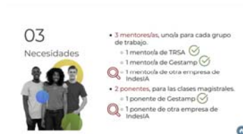
Programa de Mentoring Universidades