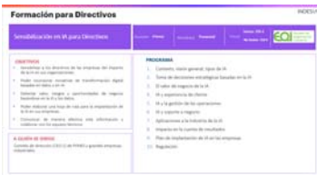
Catálogo de cursos IndesIA