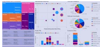
Catálogo de casos