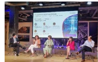
Framework de Data & IA