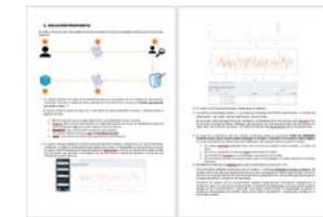
Caso de Uso demostrador