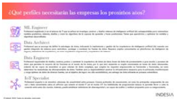
Perfiles formativos Data & IA