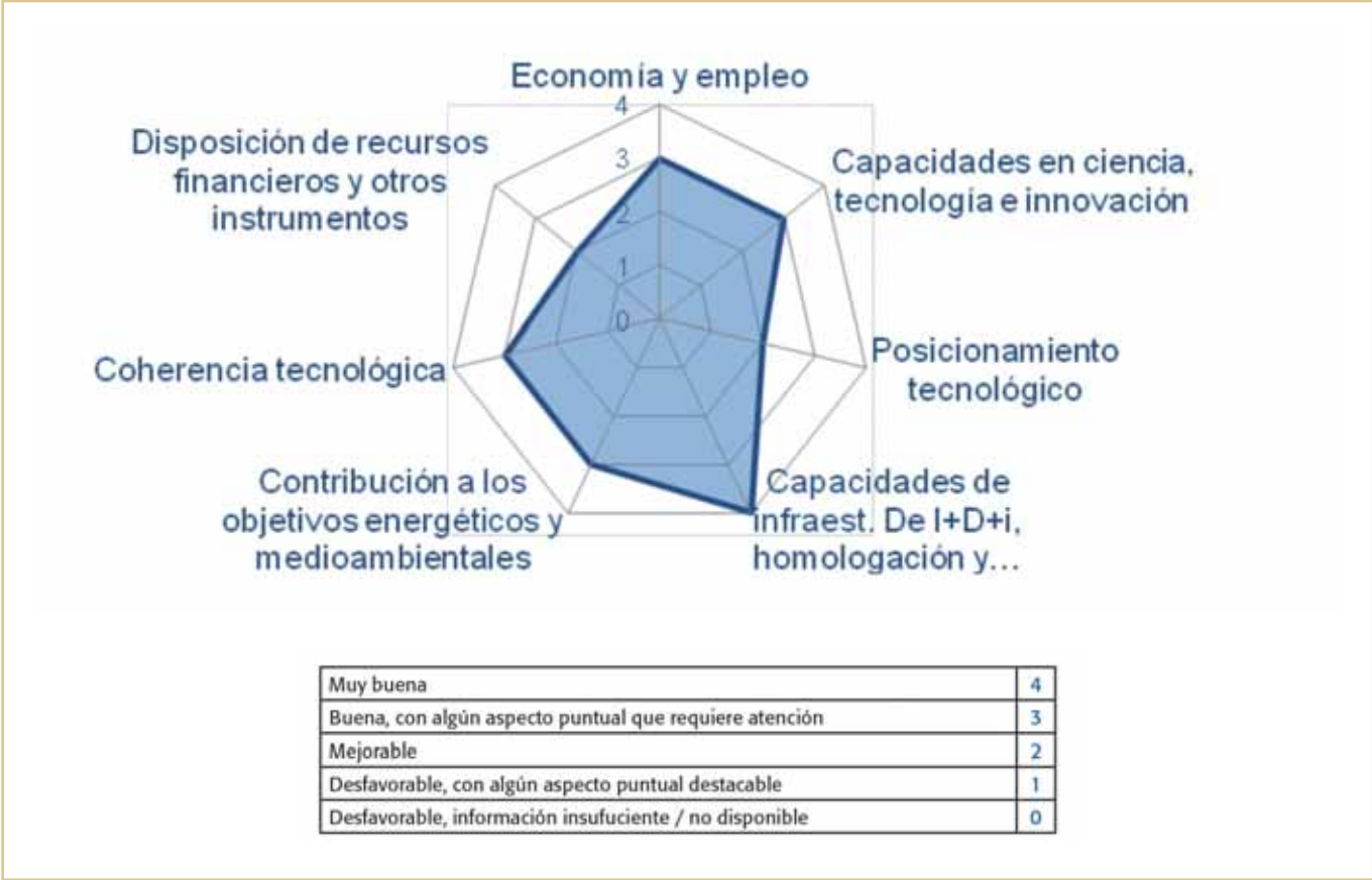
Necesidad de Alianzas Territoriales