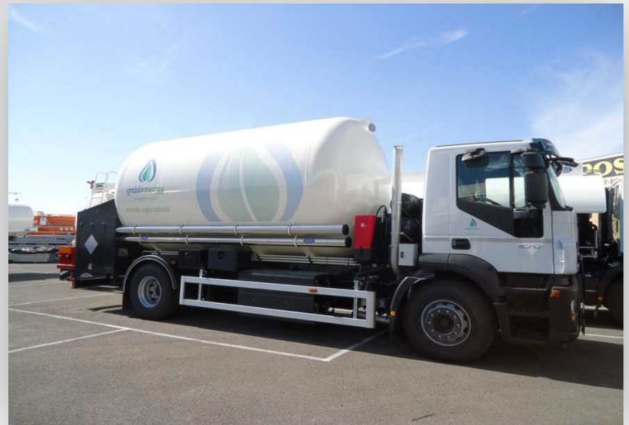
Cisterna de GNL