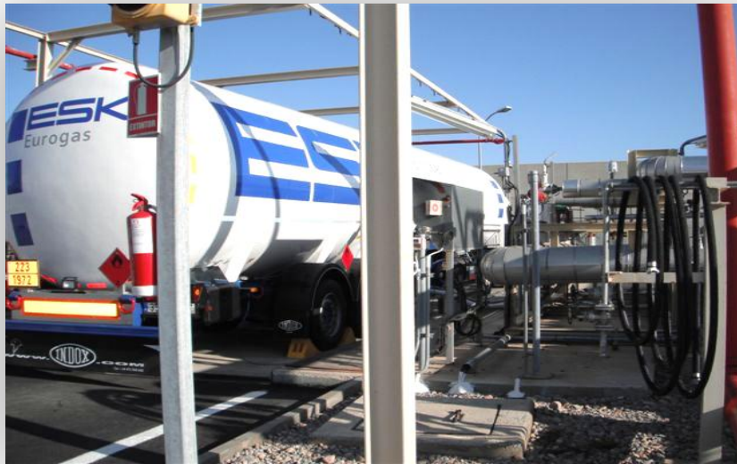
Carga de cisterna GNL