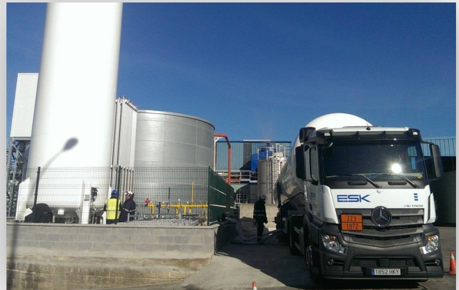
Descarga de cisterna en Small Scale LNG